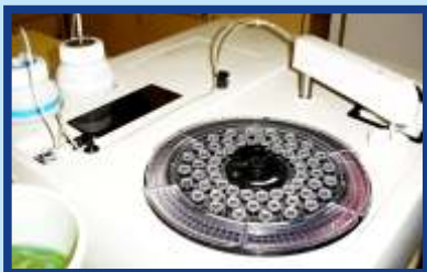
■ Automação em bioquímica, um avanço com novas tecnologias.

Garantir a segurança e confiança nos resultados dos exames laboratoriais é uma das prioridades do Bioteste. Para isso possui dois aparelhos semi automáticos e um completamente